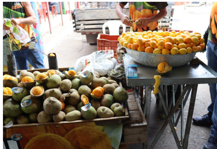
Terceira edição da Festa do Pequi se consolida como maior evento sobre o fruto

A quantidade de pequi vendido na Centrais é bem maior que o que se extrai no estado. No entreposto, o fruto começa a chegar em setembro, com a remessa do Tocantins.