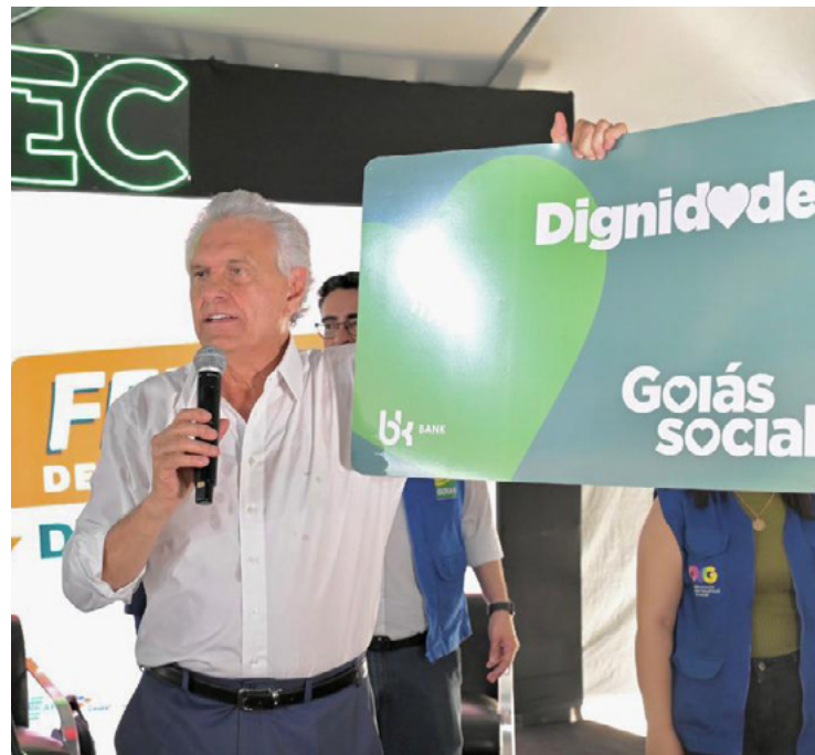
Caiado defende formação profissional e mais oportunidades durante Feirão de Empregos do Goiás Social

Foram realizadas 480 inscrições em cursos gratuitos de qualificação dos Colégios Tecnológicos (Cotecs), que oferecem Crédito Social no valor de até R$ 5 mil para os concluintes que atendam aos requisitos. “Iniciamos com apoio, formação, profissionalização, educação de qualidade, sensibilidade humanitária e, depois, os beneficiários estão aptos a continuar sua própria vida”, destacou Caiado. Nesse sentido, também há oferta de financiamento pela Goiás Fomento, serviço procurado por mais de 400 cidadãos até agora.