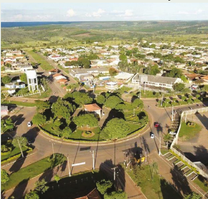
Centro de Abadiânia

A Assembleia Legislativa de Goiás (Alego) promoverá em Abadiânia a segunda edição do projeto “Deputados Aqui”, no dia 21 de outubro. A iniciativa visa oferecer diversos serviços para a população, como emissão de documentos, atendimentos nas áreas social, jurídica e de saúde. Durante o evento serão realizados atendimentos oftalmológicos oferecidos pelo SESC VISÃO, atendimentos jurídicos pela Defensoria Pública de Goiás, serviços na área básica de saúde, como aferição de pressão, teste de glicemia e outros cuidados médicos e odontológicos.