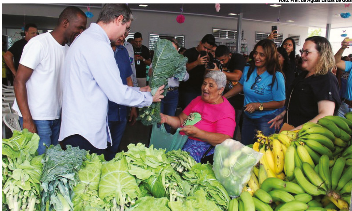
Águas Lindas conta com mais de 200 famílias cadastradas e pessoas de diversos bairros.

O PAA (Programa de Aquisição de Alimentos), se