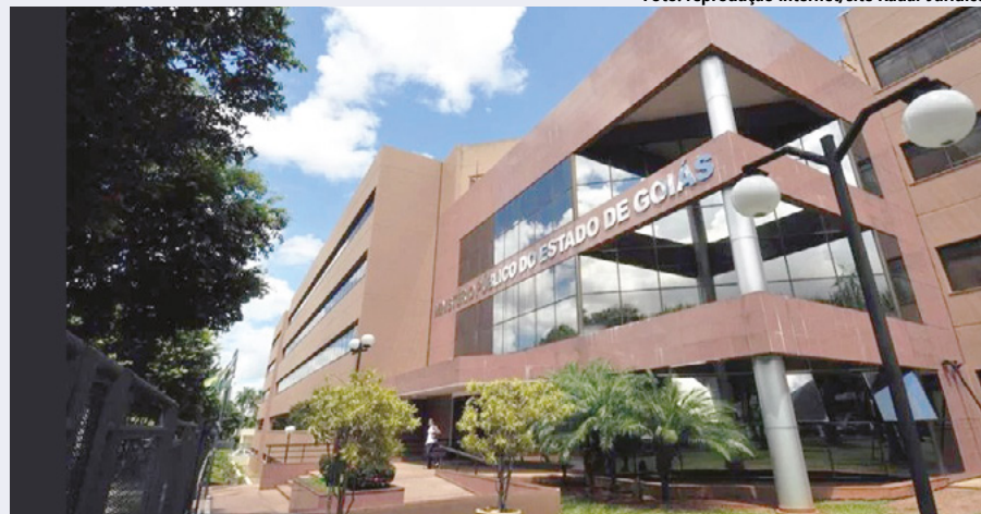
Para obter informações adicionais sobre o concurso, os interessados podem consultar a página oficial do MPGO