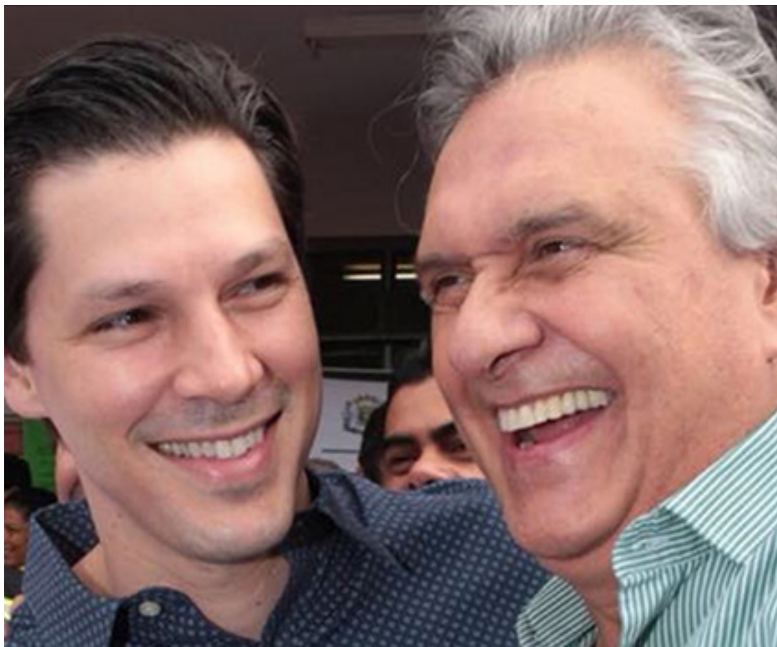
Ronaldo Caiado e Daniel Vilela: força da base aliada no interior do estado