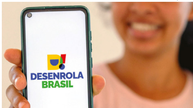
De acordo com o Procon Goiás poderão ser renegociados débitos bancários e não bancários, contraídos de 1º de janeiro de 2019 até 31 de dezembro de 2022