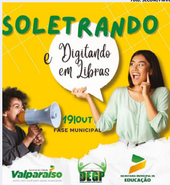
A fase municipal ocorrerá no auditório da secretaria municipal de educação