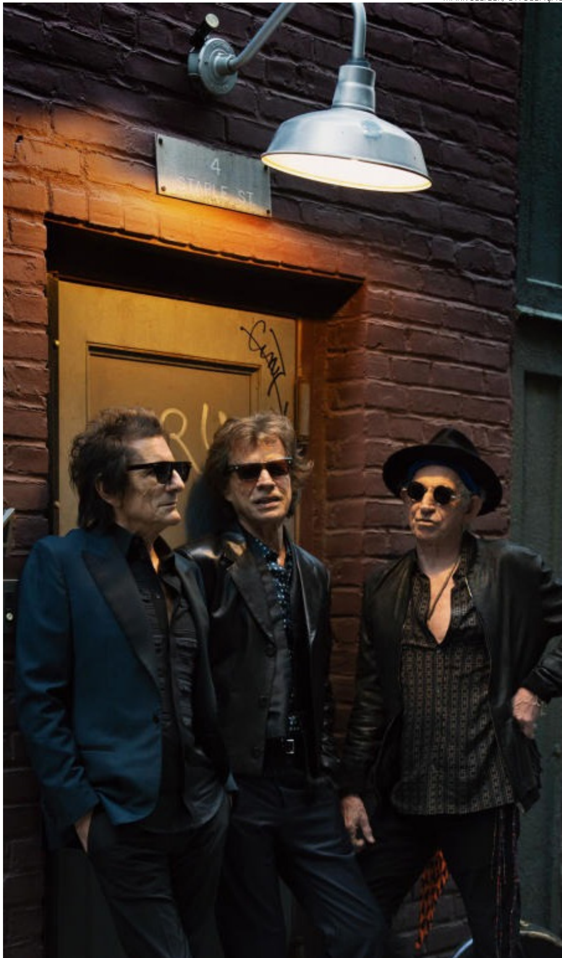
Ron Wood, Mick Jagger e Keith Richards: Stones ressurgem com poderoso disco

Já tentei escrever zilhões de vezes sobre a sensação que é esperar anos por um disco de inéditas anunciado por Jagger, Richards e Wood (Charlie, você nunca será esquecido), mas acabo sempre voltando a faixa pro início, me levanto da cadeira, escuto os singles ("Angry" e "Sweet Sounds of Heaven") de novo e me deixo cair no rock. Não nego pra ninguém: curto música que tenha alma. Os Sto-