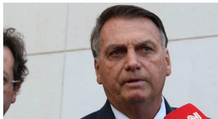
Jair Bolsonaro: eleições presidenciais de 2022 são “páginas viradas”

Ao ser perguntado se tinha discutido com militares sobre um golpe contra a posse de Lula, questionou: “Você viu a movimentação de um soldado por aí?”.